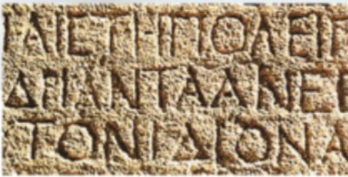
Détail des Lois de la cité de Gortyne, en Crète, V e siècle avant J.-C., musée du Louvre, Paris.