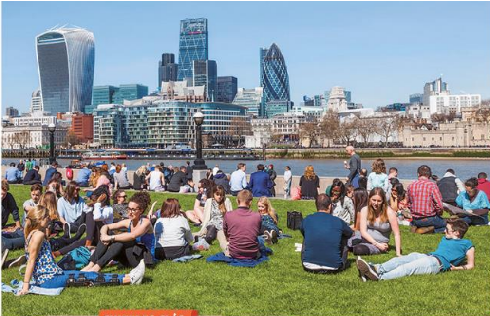
4 La City, le centre d'affaires de Londres (2013)