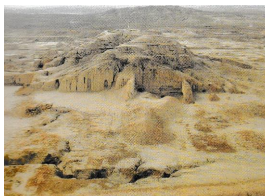
▲ Le site archéologique de nos jours (à Warka, en Irak actuel).

La tour centrale s'appelle une ziggourat . Dans ce temple dédié à Inanna-Ishtar, les archéologues ont découvert les plus anciennes tablettes écrites.